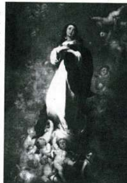
La Inmaculada "de Soul" (1678). Bartolomé Esteban Murillo.

Será ya en el siglo XVII, cuando se adopta